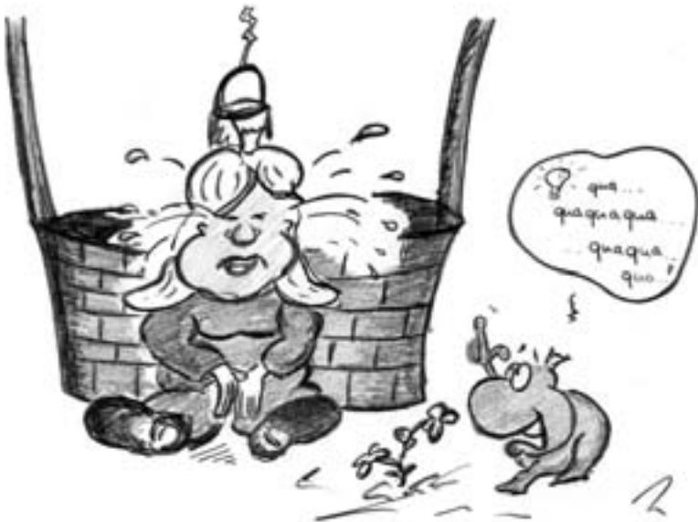
A Frosch, der saubläd daherredn kann, Sachn gibt’s.

Wia sie sich dann a weng dafangd, mault’s zruck , weil’s ihr ja eh scho glangd: “Hoit s’ Mei , du Aff, des geht di doch glei zerst nix o, wos i do moch!“