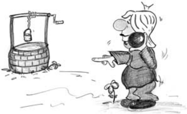
De Prinzessin beim Kugelstoßen – stocknarresch wars damit

Und wos ihr am oia bessern gfoid, des war a Kugel, ganz aus Goid. Des is ihr liabstes Spui zeig gwen, ohne der host as ned gseng . De wirfts in d'Höh, und fangds dann wieder, und foids amoi am Erd bodn nieder, dann glaubt's es zam, de Freud is groß, scho geht der Gspoaß vo vorne los. Mei , do hod sie's aber näde, do wirft's und fangd's, so wia a Bläde. Heid doan's Computer spuin, de junga Kundn, aber der war ja do no ned erfundn. Wos jetz kimmd, is leicht zon Darodn: de Kugel foid – doch ned am Bodn,